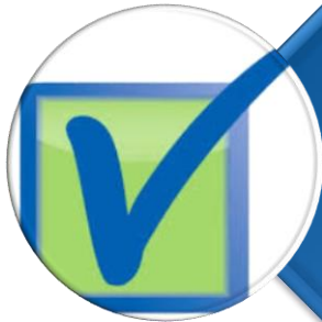
Tabla de Contenido