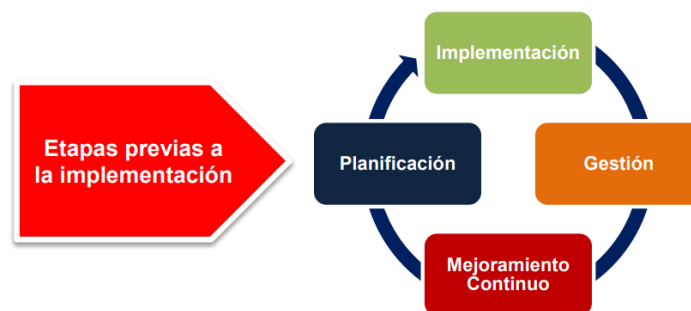
ILUSTRACIÓN 1 - MODELO DE OPERACIÓN DEL MSPI

El Ministerio de Tecnologías de la Información y las Comunicaciones – MinTIC definió el Modelo de Seguridad y Privacidad -MSPI el cual fue facilitado a las entidades del Estado colombiano con el fin de que estos lo adopten e incrementen el nivel de madurez en los temas de seguridad y privacidad de la información. De acuerdo con lo anterior, la metodología de implementación del Plan de Seguridad y Privacidad del Icfes, está basado en el ciclo PHVA (Planificar-Hacer-Verificar-Actuar) y lo establecido en el MSPI y se ejecuta a través del mapa de ruta definido a continuación: