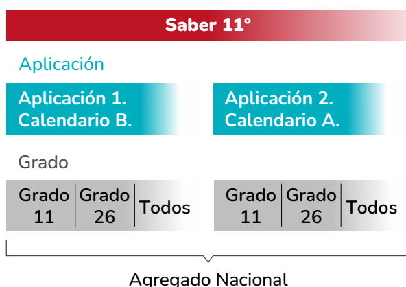
• Figura 1. Agregado Nacional

Aunque estos resultados se publican de forma anual, en una primera etapa, los resultados se organizan según la aplicación del examen, distinguiendo entre quienes presentaron en la primera aplicación del año (generalmente calendario B) y quienes lo hicieron en la segunda (generalmente calendario A). Posteriormente, dentro de cada aplicación, la población se clasifica por grado: 11, 26 y el grupo Todos que corresponde a la combinación de ambos. Esta estructura da lugar al agregado nacional.