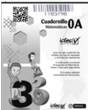
Gráfico 1: Cuadernillo estándar personalizado

El contratista debe disponer para el proceso de numeración de cuadernillos, los equipos electrónicos, software y personal necesarios para concluir esta labor satisfactoriamente, en la oportunidad y con la calidad requerida por el ICFES.