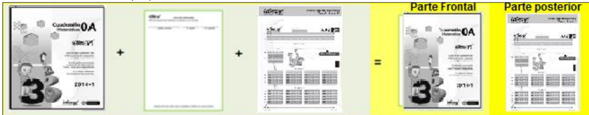
Gráfico 6: Ensamble de paquetes