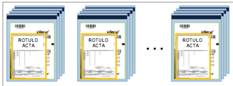
Gráfico 7: Agrupación de paquetes de material de examen