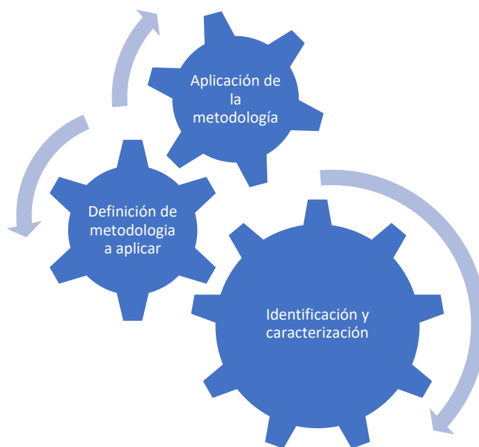
Ilustración 2. Metodología para realizar valoración económica