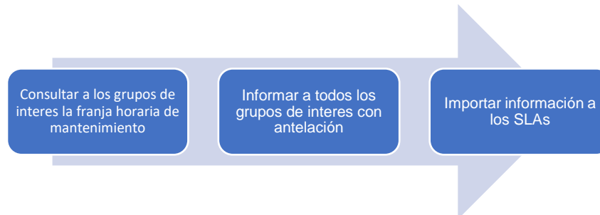
Gráfica 1. Procesos de planeación de mantenimiento.

Para la realización del plan de mantenimiento preventivo de los servicios tecnológicos del ICFES, se tuvo en cuenta la guía de servicios tecnológicos del Marco de Referencia de Arquitectura Empresarial de MinTIC para los siguientes pasos: