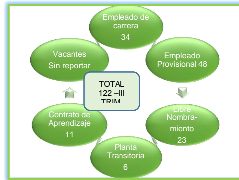
Tercer Trimestre 2017

En relación con el trimestre anterior, se evidencian variaciones así: En la nómina de servidores públicos de planta ( Carrera administrativa y transitoria ), disminución de 1 cargo, en cuanto a los servidores provisionales aumentaron 3 cargos, para libre nombramiento disminuyó 1 cargo y los pasantes disminuyeron en 1 cargo.