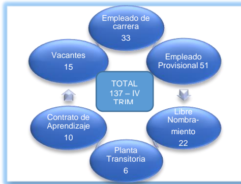
Cuarto Trimestre 2017