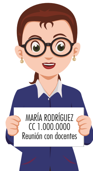
Imagen 3. Ejemplo de letrero con datos