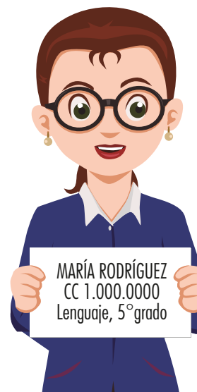
Imagen 4. Ejemplo de hoja con datos