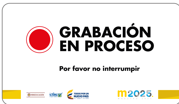
Imagen 1. Ejemplo de aviso de grabación en proceso