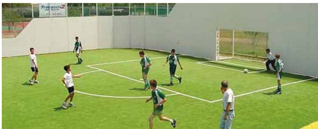
Imagen 3. Sugerencia ubicación de la cámara en exteriores