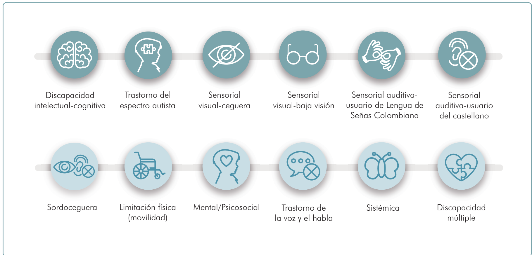
Figura 3. Tipos de discapacidad