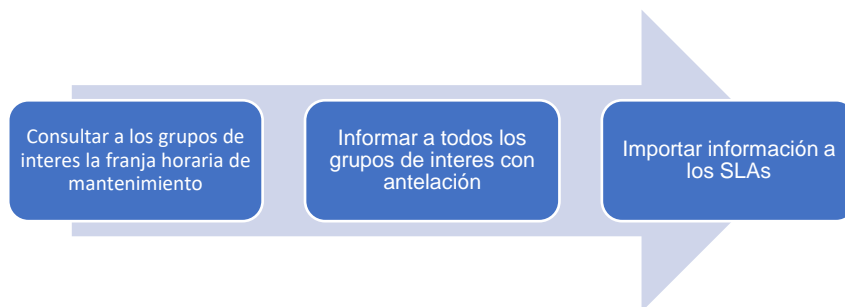
Gráfica 1. Procesos de planeación de mantenimiento.

Para la realización del plan de mantenimiento preventivo de los servicios tecnológicos del ICFES, se tuvo en cuenta la guía de servicios tecnológicos del Marco de Referencia de Arquitectura Empresarial de MinTIC para los siguientes pasos: