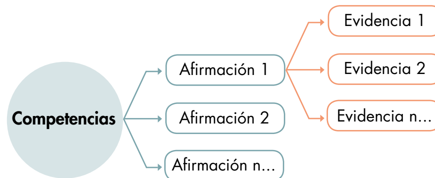
Figura 1. Diseño Centrado en Evidencias

Para consultar la metodología usada en la construcción de los módulos y pruebas de los exámenes Saber, le invitamos a hacer clic aquí .