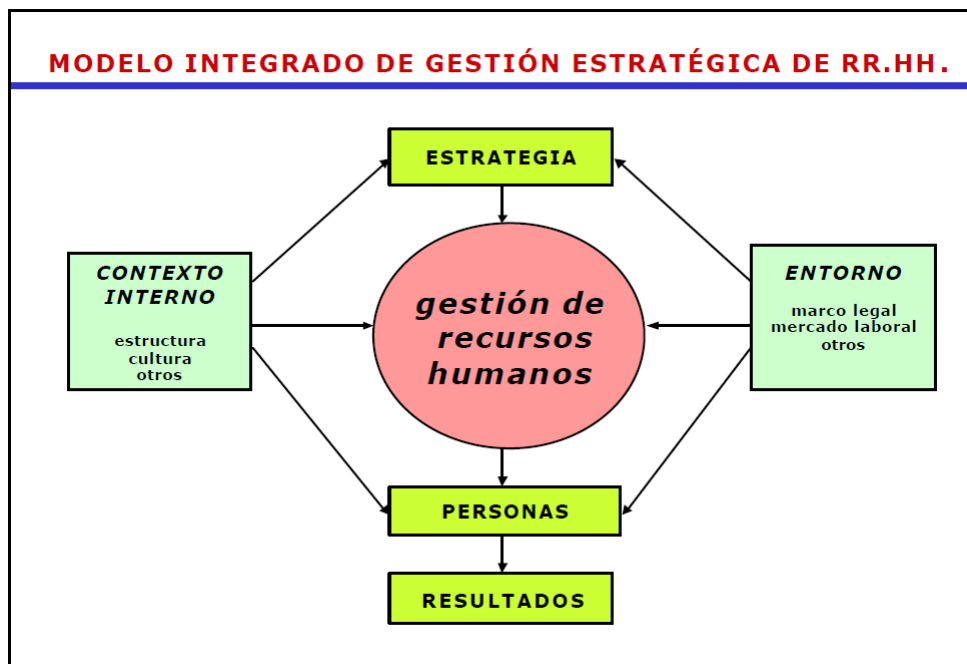
Figura N° 1. Modelo Integrado de Gestión Estratégica del Recurso Humano adaptado de Serlavós, tomado de: (Longo, 2002 pág. 11)

Es un sistema integrado de gestión, cuya finalidad básica o razón de ser es la adecuación de las personas a la estrategia institucional (Longo, 2002. pág. 13.). El éxito de la Planeación Estratégica del Recurso Humano se da en la medida en que se articula con el Direccionamiento Estratégico de la Entidad (misión, visión, objetivos institucionales, planes, programas y proyectos). Por consiguiente, dicho modelo consta de lo siguiente: